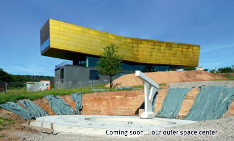
Coming soon... our outer space center