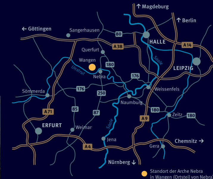
Standort der Arche Nebra in Wangen (Ortsteil von Nebra)